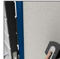
... und schon öffnen Sie die Tür mit Ihrem Finger!