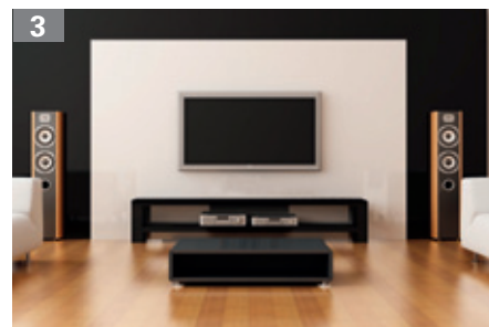
zu 3: „Kabellose“ Installation mit dem Multimedia-Rohr