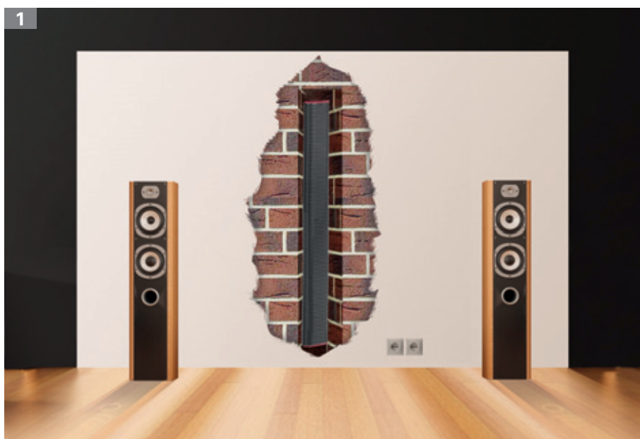
zu 1: Multimedia-Rohr in der Wand montiert