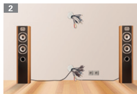
zu 2: Verlegte Kabel unter Putz