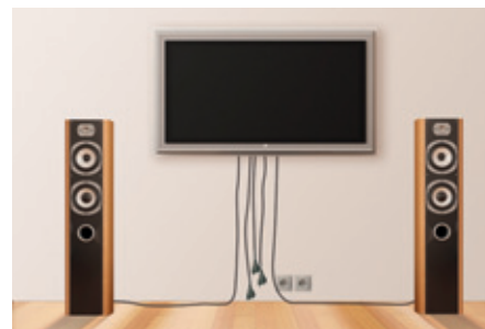
Bisherige Installation ohne Multimedia-Rohr

Um ein verlaufen der Bohrkronen zu vermeiden, sollte mit einem 6 mm Bohrer vorgebohrt werden.